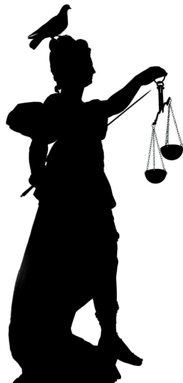
Een beeld van Vrouwe Justitia in Frankfurt